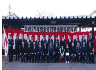
＜歳末警戒部隊発隊式＞