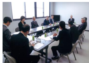
＜すさみ町都市提携協議会＞