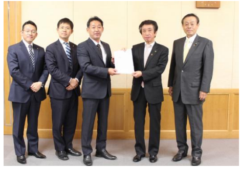
＜市長に予算要望書提出＞