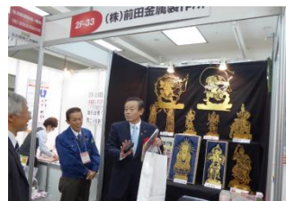
＜ビジネスチャンス発掘フェアー＞