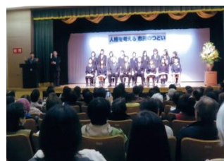
＜人権を考える市民のつどい＞