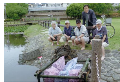
<竹すみで水の浄化活動>