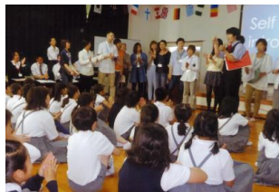
<寝屋川市「英語村」開村式>