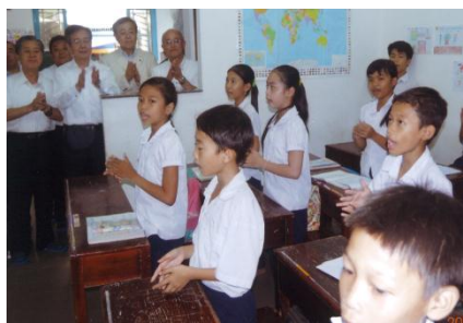
<ベトナムの教育施設視察>