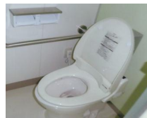
<小中学校に洋式トイレ設置>