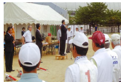
<ゲートボール大会>