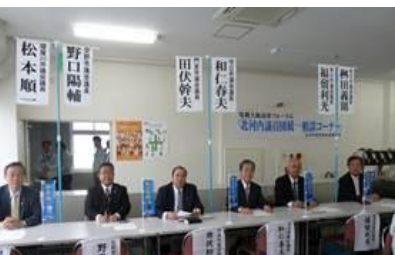
<電機北河内議員団統一相談>