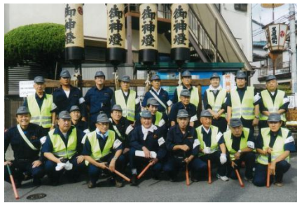
<地域防犯活動に参加>