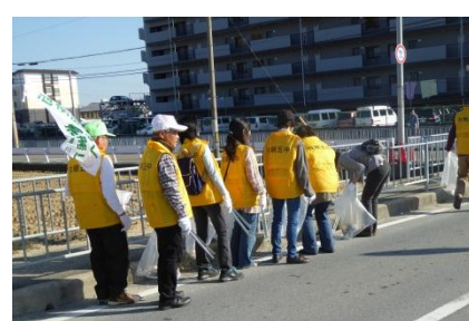
<ねやがわクリーンデー>