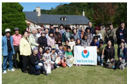
<四季の行事: イングランドの丘>