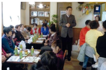
<松ちゃんと語ろう会(高柳5丁目地区)>