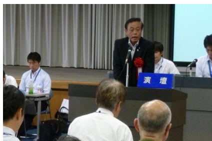
<労働組合定期大会>