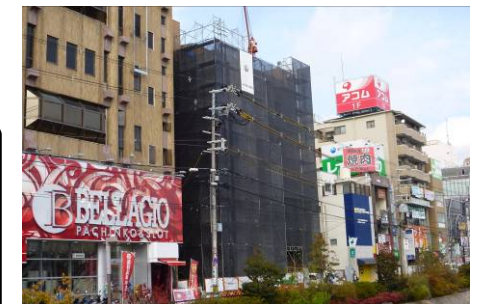
<耐震とエレベータ設置工事中>

寝屋川市は産業振興条例を制定し、商業・工業・農業の活性化に取り組んでいます。この、にぎわい創造館はその拠点となるもので、市民や事業者に気軽に出入りしていく事が必要と考えます。管内もリニューアルされ活気あふれる会館になるように期待しているところです。