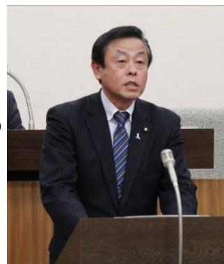
<議上で委員長報告>