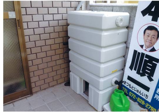
＜雨水貯蓄タンクを設置＞

自分自身でもこの治水対策に寄与出来ないかと、自宅の隅に、雨水貯留タンクの120リットルを設置しました。市民に協力いただく治水対策として、補助事業(タンク購入費の1/2、最大30,000円)の提案をしてきた私自身が、まず設置することが必要と考えたからです。“屋根に降った雨をまず自ら治水！”僅かな治水量かもしれませんが、この視点は総合的治水対策と同様に必要と考えます。貯留した雨水は、環境にやさしく近隣の花や木に散水しています。皆さんも設置どうですか？