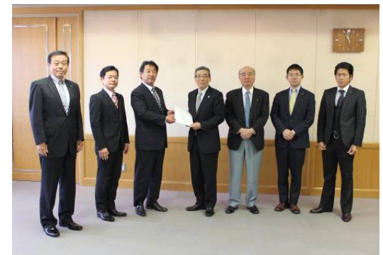
＜会派要望市長に提出＞