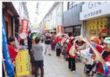
<香里地区100円商店街>