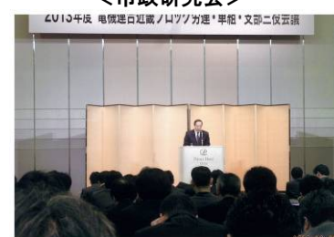
＜電機連合近畿ブロック会議＞