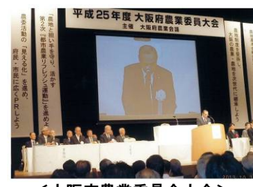
＜大阪府農業委員会大会＞