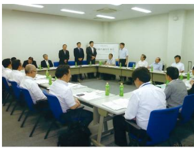
＜パナソニック組織内議員団総会＞