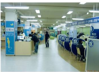
＜本庁窓口リニューアル＞