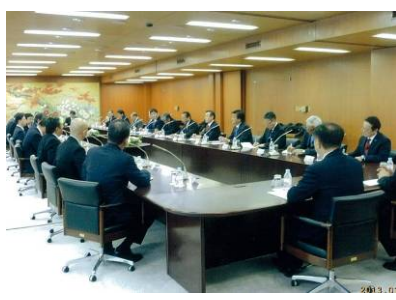
＜パナソニック本社役員との新年意見交換＞