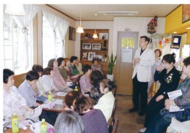
＜松ちゃんと語ろう会(高柳5丁目地区)＞