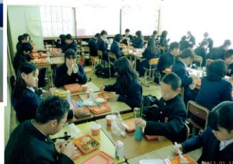
＜中学校に給食導入＞