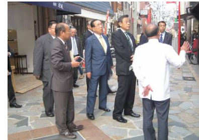
＜建設水道常任委員会視察＞