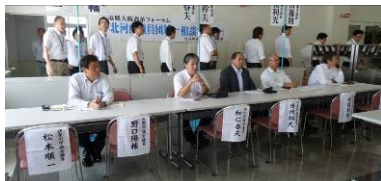
＜電機北河内議員団統一相談＞